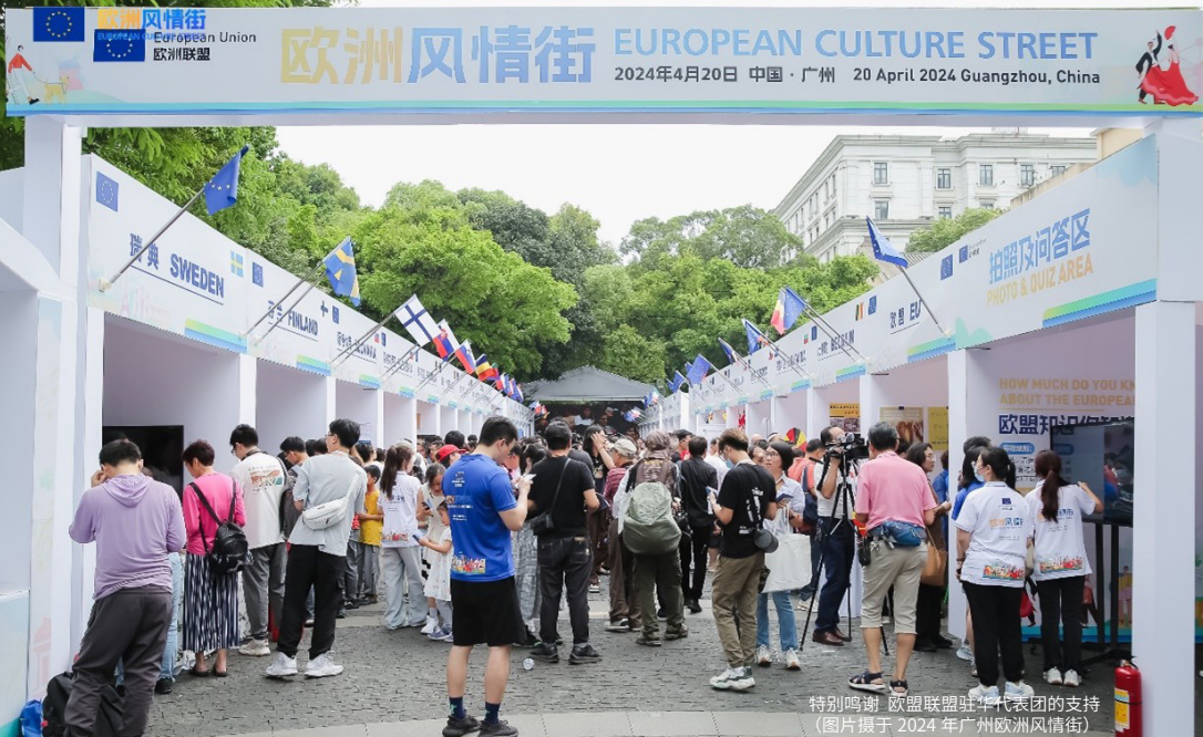
特别鸣谢 欧盟联盟驻华代表团的支持 (图片摄于 2024 年广州欧洲风情街)