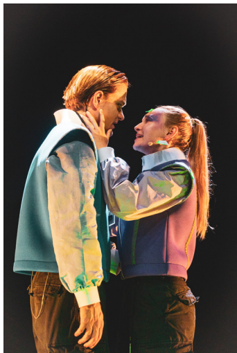
特别鸣谢 托伦维拉姆·霍日察剧院 供图