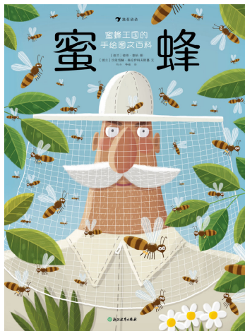
特别鸣谢 浪花朵朵出版社 供图