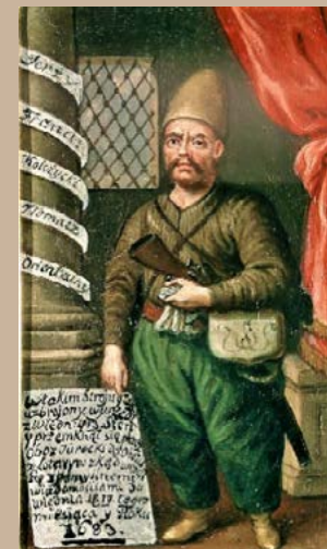
Jerzy Kulczycki v tureckých šatách

Jerzy Franciszek Kulczycki bol tlmočník tureckého jazyka poľského pôvodu, ktorý ovplyvnil osud bitky pri Viedni. Ako špión prenikol z obliehaného mesta cez turecký tábor a vrátil sa späť, aby priniesol obranom správu, že sa blížia vojská poľského kráľa s pomocou. Tato správa výrazne pozdvihla morálku a nádej na záchranu mesta. Ako odmenu za hrdinstvo kráľ Ján III. Sobieski ponúkol Kulczyckému možnosť vybrať si podiel na bohatstve, ktoré bolo ukoristené Turkom. S veľkým prekvapením si vybral okolo 500 vriec s čiernym zrnom, ktoré všetci považovali za krmivo pre ťavy. Kulczycki však vedel, ako z tohto zrna urobiť chutný napoj. Kaviareň, ktorú otvoril, sa stala populárnym a vyhľadávaným miestom spoločenských stretnutí. Jerzy Kulczycki sa považuje za otca baristov v Európe.