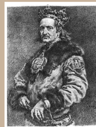
Vladislav II. Jagelovský