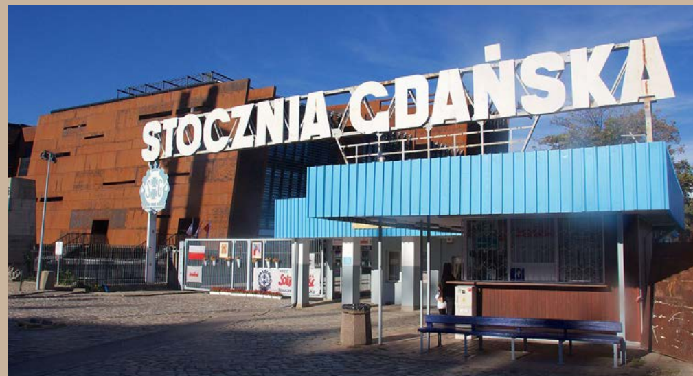
Brána č. 2 Gdanskej lodenice pred budovou Európskeho centra Solidarity