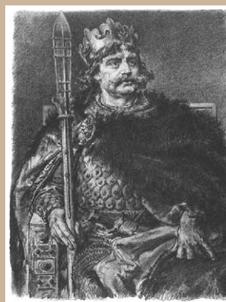
Boleslav I. Chrabrý

https://bankomania.pkobp.pl/media_files/278c7196-4d3b-42cf-a062-d800daa3e19a.pdf