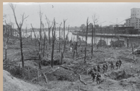
Westerplatte po konci bojov, 9. septembra 1939