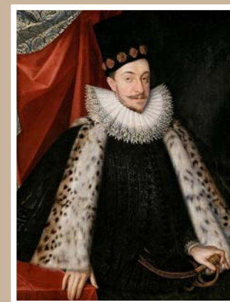
Žigmund III. Vasa