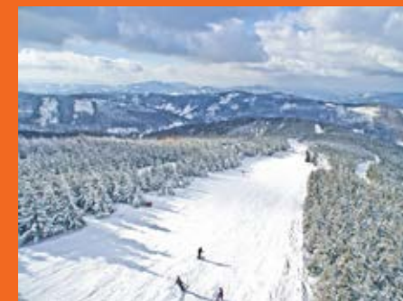
Szczyrk Mountain Resort