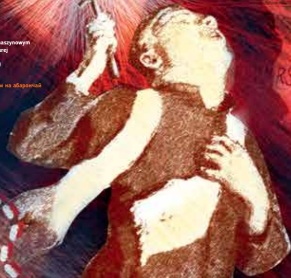
Śmierć księdza Ignacego Skorupki, reprodukcja obrazu Romana Bratkovskiego