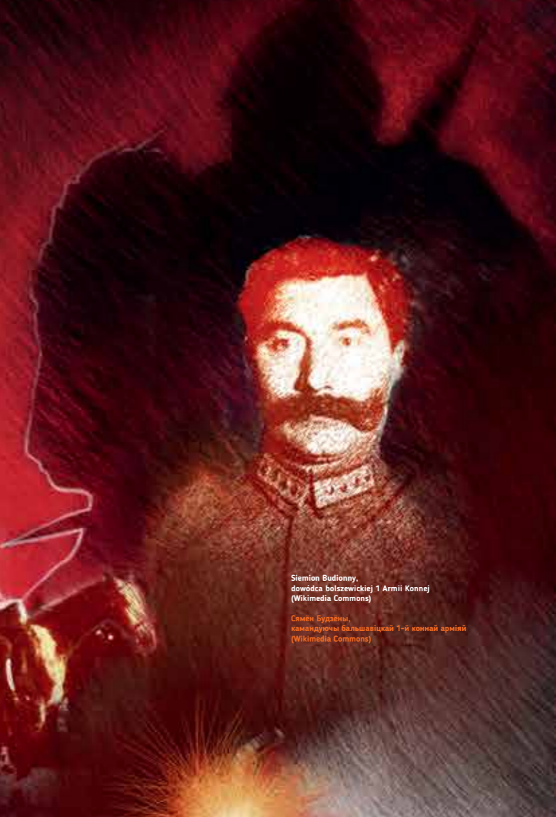
Siemion Budionny, dowódca bolszewickiej 1 Armii Konnej