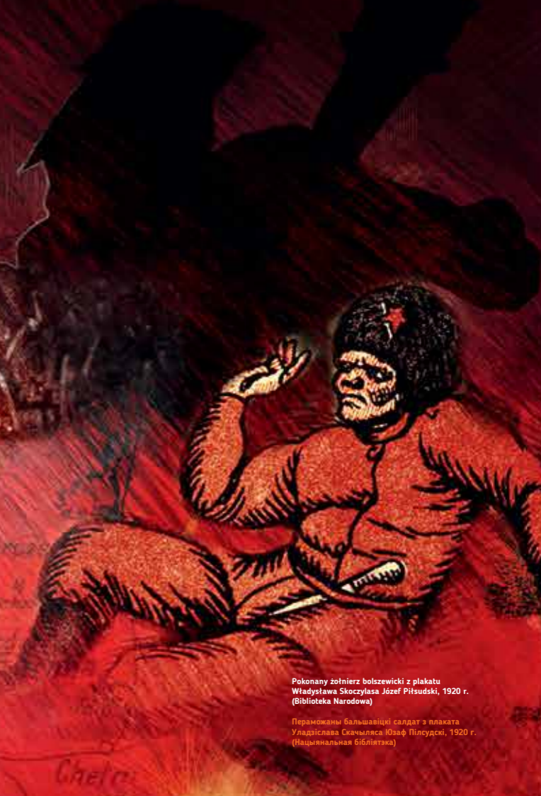
Поранены żołnierz bolszewicki z plakatu Władysława Skoczylasa Józef Piłsudski, 1920 r.