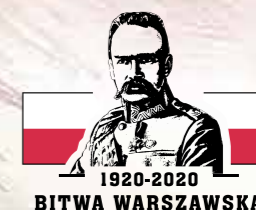
1920-2020 BITWA WARSZAWSKA

Пагроза незалежнасці Польшчы прывяла да прыпынення палітычных спрэчак. 1 ліпеня 1920 года была створана Рада абароны дзяржавы на чале з маршалам Юзафам Пілсудскім. Яна часова ўзяла на сябе абавязкі Сейма. Замест кабінета Уладзіслава Грабскага 24 ліпеня быў створаны дзвюхпартыйны Урад Нацыянальнай Абароны. Кіраваў ім сялянскі палітык Вінцэнт Вітас, а пасаду віцэ-прэм'ера заняў сацыяліст Ігнацы Дашынскі. Падтрымкай жаўнераў і прапагандысцкай дзейнасцю займаліся Грамадзянскія камітэты дзяржаўнай абароны, якіх было створана каля 3 тыс.