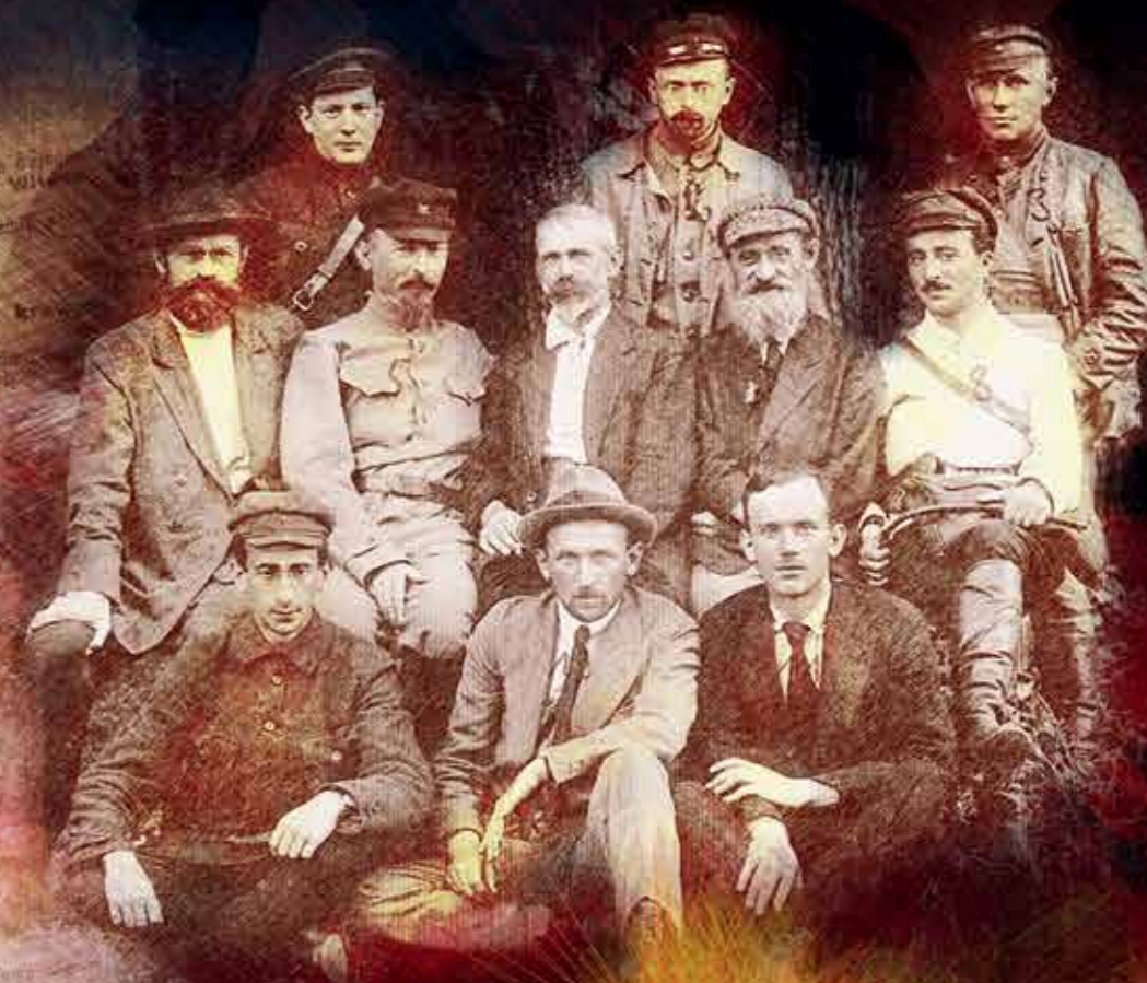
Członkowie Tymczasowego Komitetu Rewolucyjnego Polski (Polrewkomu), sierpień 1920 r. Był to utworzony przez bolszewików ośrodek polityczny, mający sprawować władzę w zdobyczej Polsce. W środkowym rzędzie drugi od lewej Feliks Dzierżyński, obok Julian Marchlewski i Feliks Kon