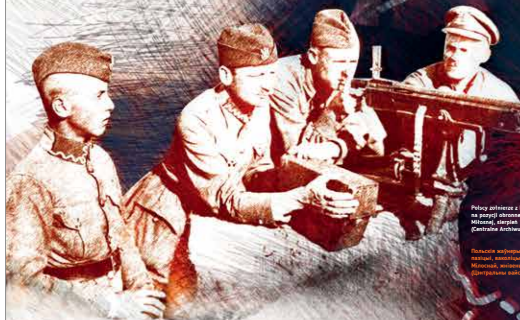
Polscy żołnierze z karabinem maszynowym na pozycji obronnej, okolice Starej Miłosnej, sierpień 1920 r.