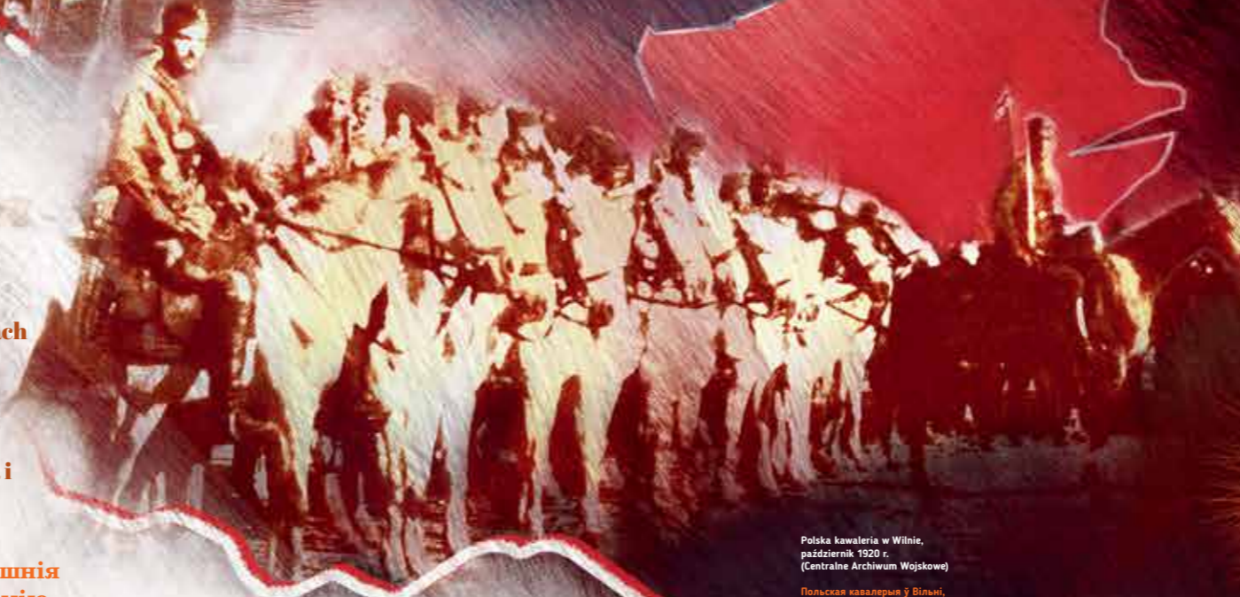
Polska kawaleria w Wilnie, październik 1920 r.