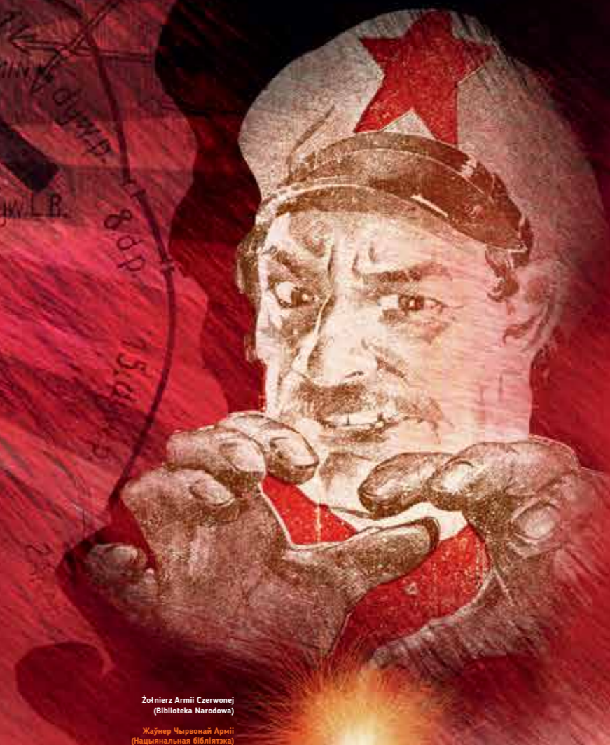
Żołnierz Armii Czerwonej