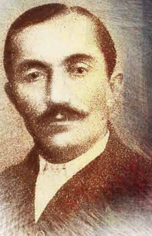
Wincenty Witos, działacz ruchu ludowego, premier Rządu Obrony Narodowej, ok. 1920 r.