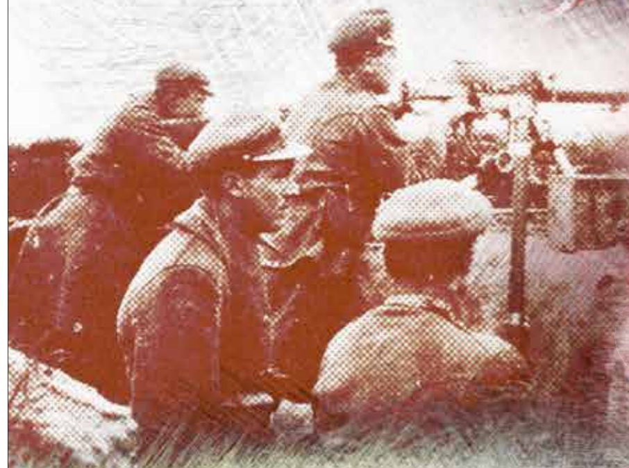
Zołnierze 35 Pułku Piechoty na pozycji pod Lunińcem na Polesiu, lipiec 1919 r.