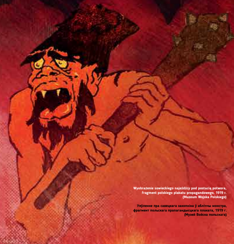
Wyobrazenie sowieckiego najeźdźcy pod postacią potwora, fragment polskiego plakatu propagandowego, 1919 r. (Muzeum Wojska Polskiego)