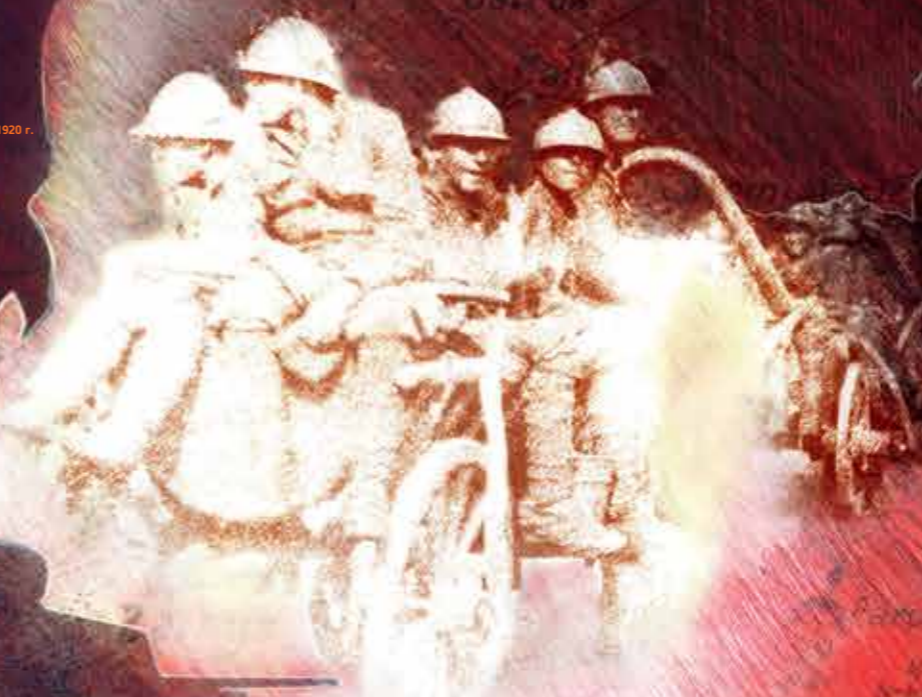
Żołnierze 1 Pułku Piechoty Legionów podczas ofensywy na Białystok, sierpień 1920 r.