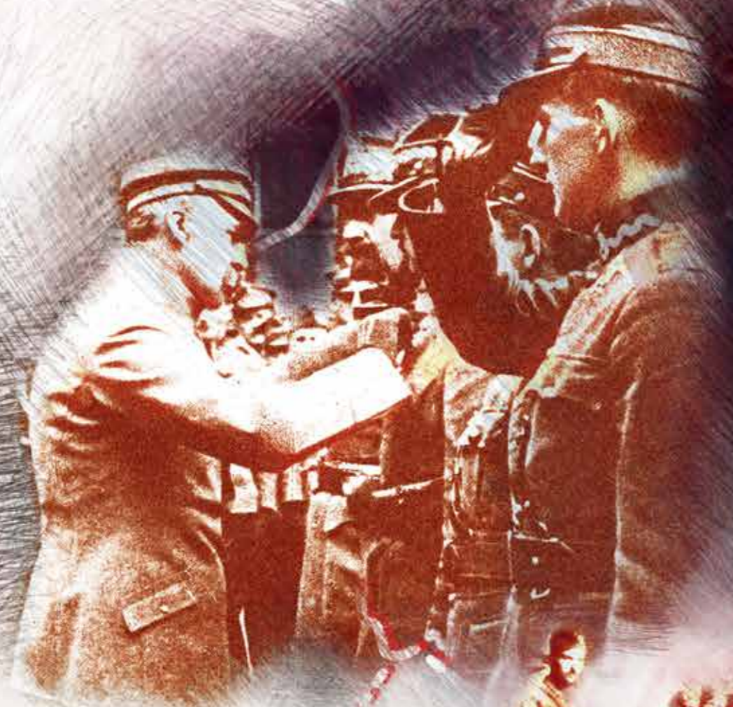
Marszałek Józef Piłsudski odznacza oficerów (m.in. generała Tadeusza Rozwadowskiego) Orderem Wojskowym Virtuti Militari V klasy, Warszawa, 14 września 1920 r.