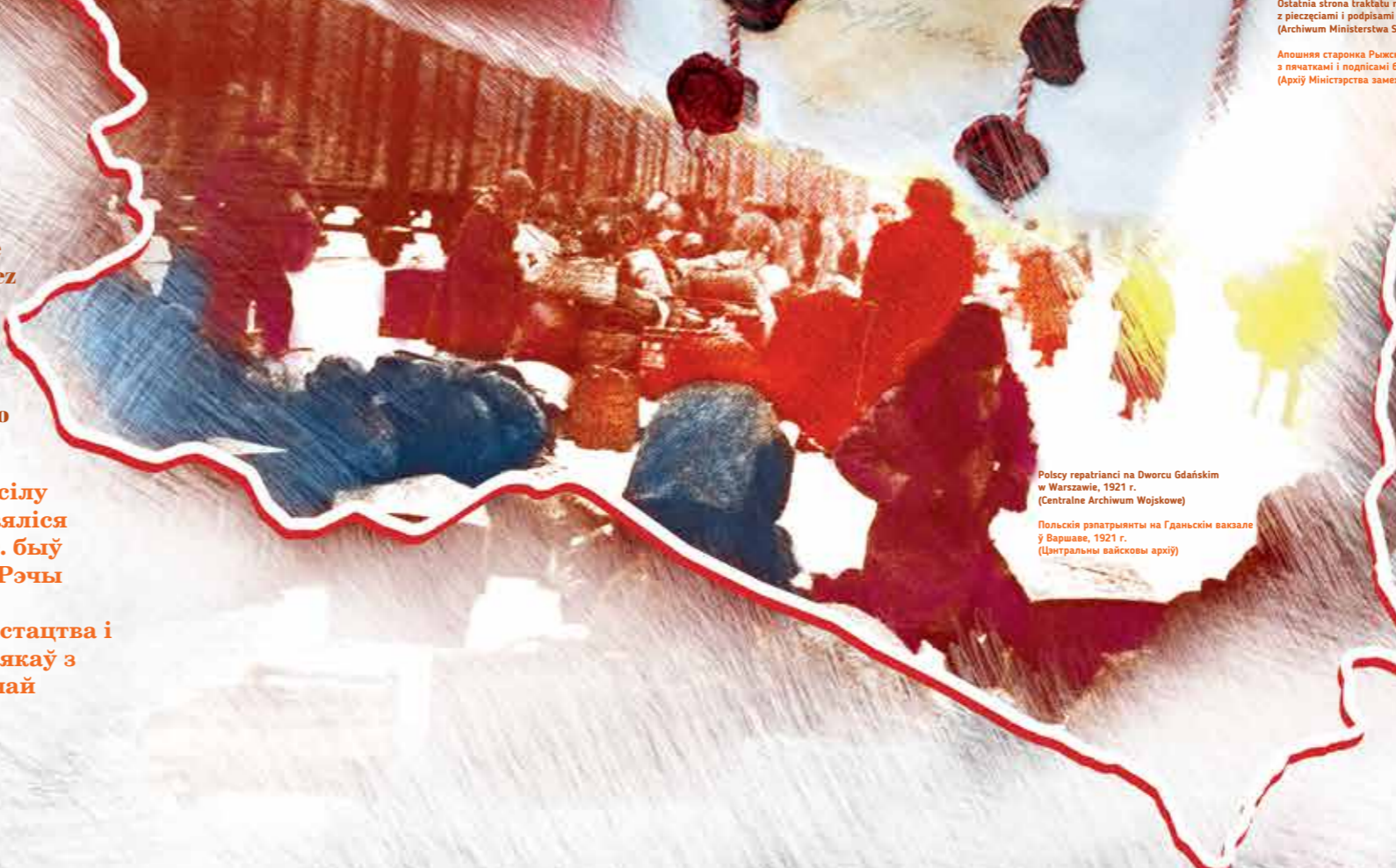
Polscy repatrianci na Dworcu Gdańskim w Warszawie, 1921 r.

Перамір'е на польска-бальшавіцкім фронце ўступіла ў сілу 18 кастрычніка 1920 года. Дыпламатычныя перамовы вяліся цягам наступных месяцаў у Рызе, дзе 18 сакавіка 1921 г. быў заключаны мірны дагавор. Ён абазначаў мяжу Другой Рэчы Паспалітай на ўсходніх рубяжах, а таксама загадваў бальшавікам вярнуць прысвоеныя ў мінулым творы мастацтва і архівы, а таксама зрабіць магчымай рэпатрыяцыю палякаў з Расіі. Польшча скончыла вайну за незалежнасць рашучай перамогай.