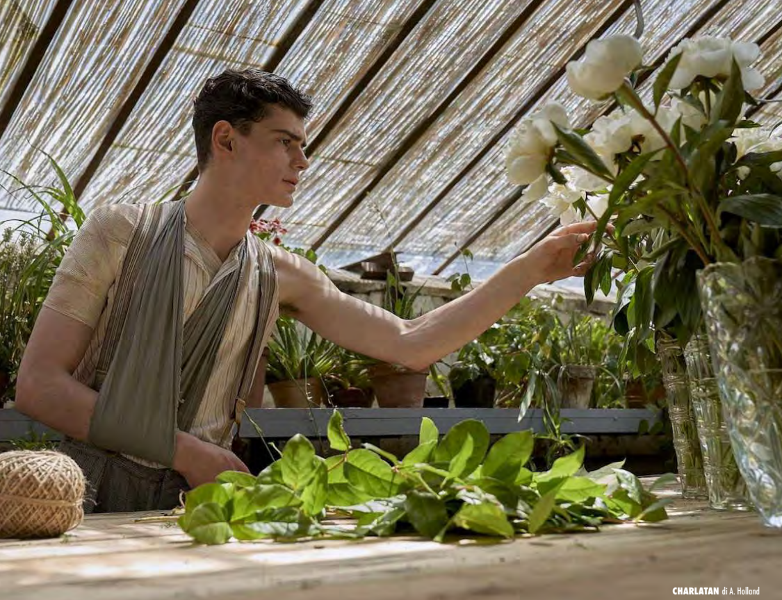
CHARLATAN di A. Holland