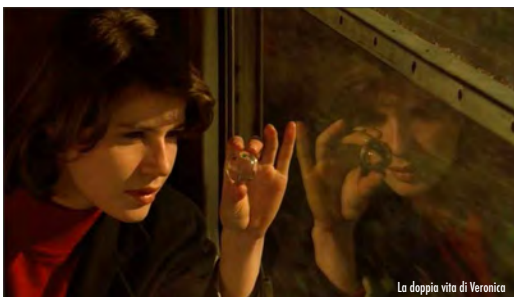
La doppia vita di Veronica

Due ragazze identiche, due paesi diversi, due storie parallele: Weronika e Véronique condividono la passione per il canto e soffrono entrambe di problemi cardiaci, ma le attende un destino diverso. Uno dei film più amati di Kieślowski, un film di "pure emozioni" come egli stesso l'ha definito, con una straordinaria Irène Jacob.