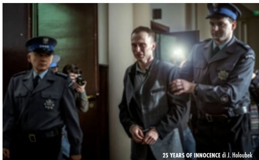
25 YEARS OF INNOCENCE di J. Holoubek

Wanda Rutkiewicz (1943 - 1992) è da molti considerata la più grande alpinista al mondo. Prima europea a scalare il Monte Everest, prima donna sulla vetta del K2, il suo sogno di conquistare tutti gli 'ottomila' si infranse sul Kangchenjunga, dove fu vista per l'ultima volta. Il documentario dell'alpinista e regista Eliza Kubarska ( The Wall of Shadow ) ripercorrere le tappe di quell'ultima spedizione. Distribuito in Italia da NFilm.