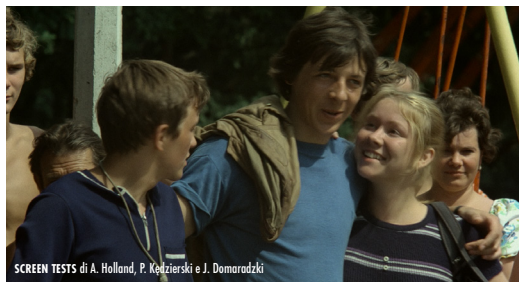
SCREEN TESTS di A. Holland, P. Kędzierski e J. Domaradzki

Uno dei primissimi film di Agnieszka Holland, brillantemente girato con Paweł Kędzierski e Jerzy Domaradzki per lo Studio X (allora diretto da Wajda), espressione del desiderio di autenticità e del rischio di cedere a compromessi di una generazione critica nei confronti del cinismo e dell'apatia diffusi.