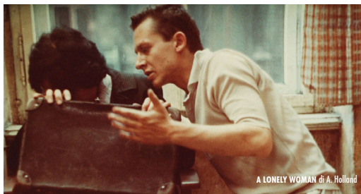
A LONELY WOMAN di A. Holland