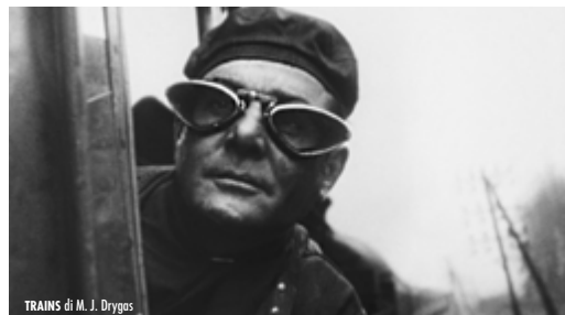
TRAINS di M. J. Drygas

in collaborazione con UnArchive Found Footage Fest e Ambasciata della Repubblica di Lituania