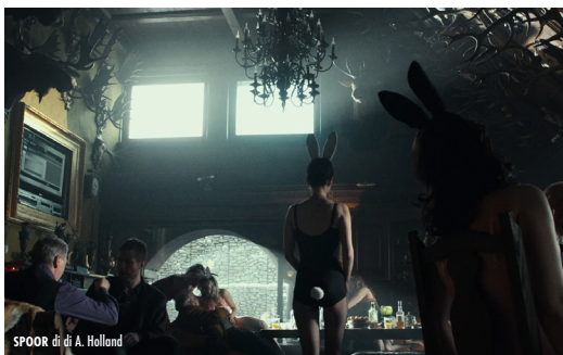
SPOOR di A. Holland

Janina Duszejko è un'eccentrica ingegniera in pensione, vegetariana, appassionata di astrologia, che vive appartata in un piccolo villaggio in montagna. In una nevosa notte d'inverno si imbatte nel cadavere del suo vicino, attorniato da impronte di cervi. Le circostanze della morte risultano misteriose. Di fronte all'impotenza della polizia, Duszejko decide di condurre l'indagine per conto proprio... Tratto dal romanzo Guida il tuo carro sulle ossa dei morti del Premio Nobel Olga Tokarczuk, co-sceneggiatrice del film, il film ha vinto l'Orso d'Argento - Premio Alfred Bauer al 67° Festival di Berlino.