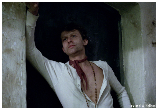
FEVER di A. Holland

Irena lavora come postina, è separata, vive con il figlio di 8 anni nella periferia di Breslavia, si prende cura di un'anziana parente malata. L'incontro con Jacek, invalido del lavoro, sembra l'inizio di una relazione che è per lei anche l'unica occasione di uscire dal proprio isolamento. Ma i problemi non cesseranno. Fortemente critico nei confronti della propaganda politica e della società della Repubblica Popolare Polacca, il film, nato per la televisione, venne bloccato dalla censura; oggi è considerato una delle opere più importanti del cosiddetto "cinema dell'inquietudine morale".