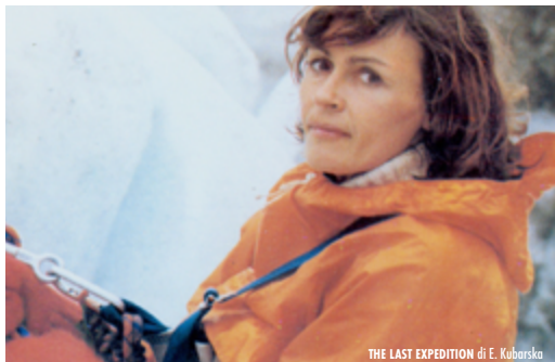
THE LAST EXPEDITION di E. Kubarska

in collaborazione con Accademia di Danimarca