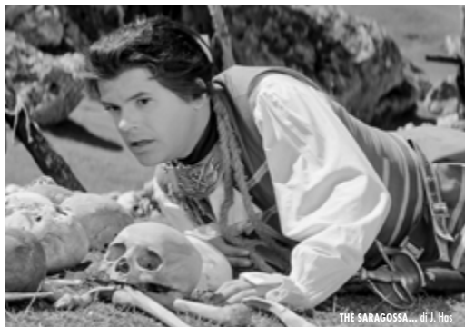
THE SARAGOSSA... di J. Has