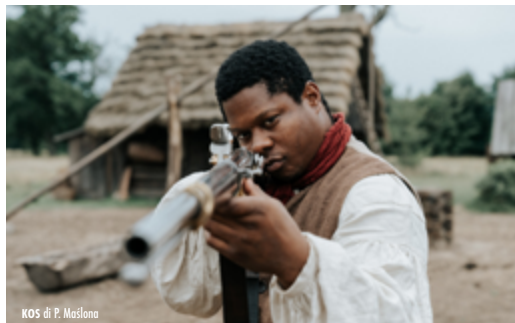
KOS di P. Maślona

Alla fine del Settecento la Polonia è divisa tra potenze straniere. Tadeusz Kościuszko "Kos" (1746-1817), già eroe della Guerra di Indipendenza americana, tornato nella terra d'origine, cerca di mobilitare la nobiltà e i contadini polacchi per una rivolta antirussa, che scoppierà nel 1794. Pluripremiato in Polonia, Kos è una rivisitazione "di genere" del filone storico-eroico, un film carico di tensione e a tratti comico, quasi tarantiniano.